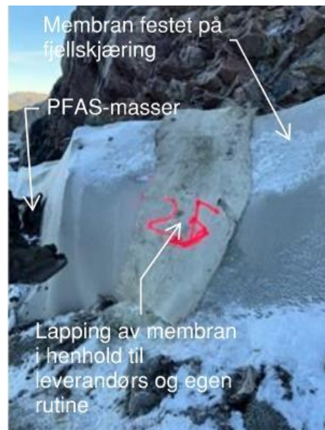
Figur 11: Bildene over viser utførelse av lapping ved funn av skade. Bilder tatt 17. Februar 2025.