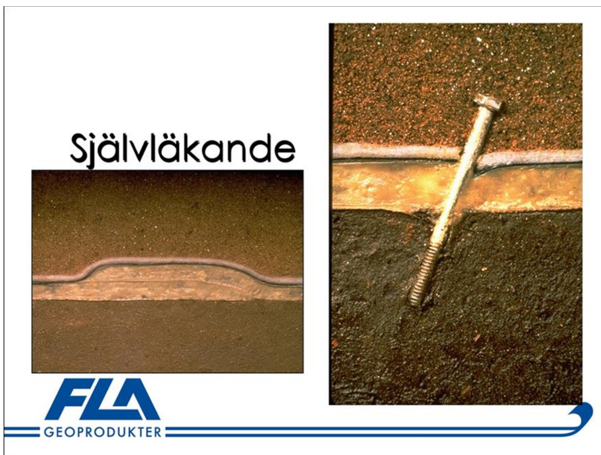
Figur 12: Illustrasjon av membranens egenskaper tilknyttet at den er selvreparerende.

Hvis det mot formodning skulle være rester av små røtter i massene som har punktert membranen, vil altså ikke dette ha noe innvirkning på tettheten til denne. For mer utdypende svar se vedlagt mailkorrespondanse med representant fra Viacon (leverandør av membran).