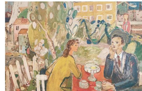
Utsmykning på Kneippen, Gunnar Haukebø, 1948.