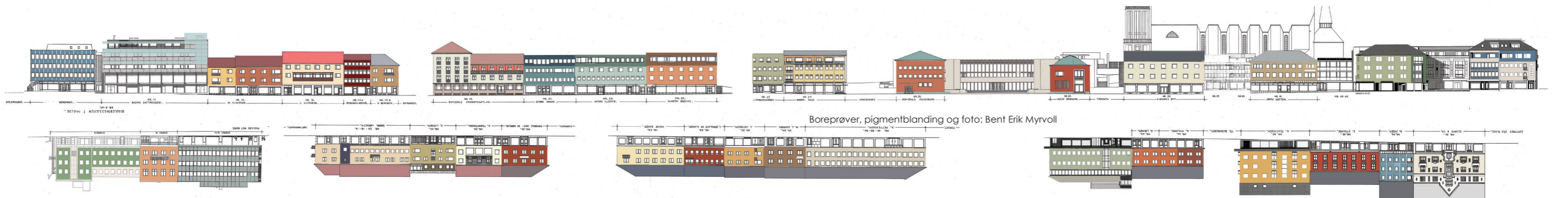
Boreprøver, pigmentblanding og foto: Bent Erik Myrvoll

Oppdatert og utfyllende info om rettledning, palett og pilot finnes på www.molde.kommune.no .