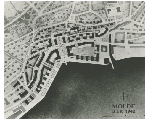
Byplan for Molde, BSR, 1942.

Det var aldri noe helhetlig fargesetting på Gjenreisningsbyen, og det tok lang tid før mange av byggene fikk farge. Men vi vet at byen frem til 80-tallet var langt mer fargerik enn den er i dag! Vi tror at en god fargepalett vil være med å løfte kvaliteten ved Gjenreisningsbyen.