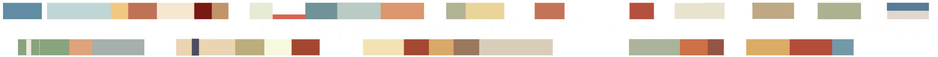
Foreslått fargeløp for Storgata 8 - 49: Mette L'orange