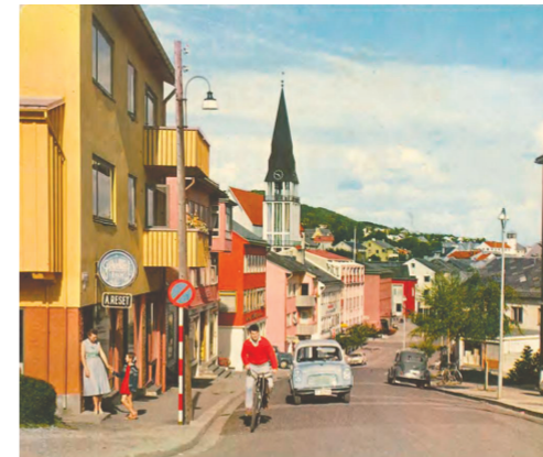
Utsnitt av postkort fra etterkrigstiden.