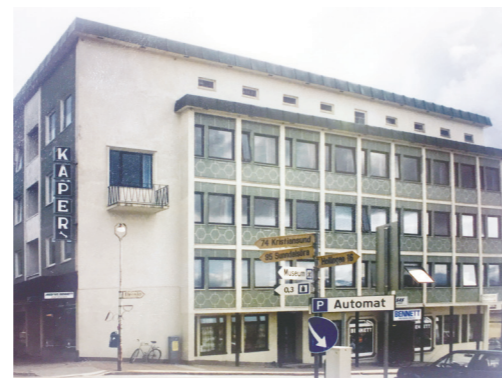
Storgata 8. Arkitekt Knut P. Bugge, 1956. Foto: Dag Ivar Brekke, 1992.